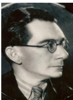
Edgar Cavalcante de Arruda Presidente