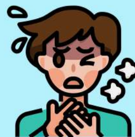
DIFICULDADE PARA RESPIRAR

Ademais, os sinais do novo coronavírus se assemelham ao de uma gripe comum, dessa forma o vírus ainda poderá apresentar: