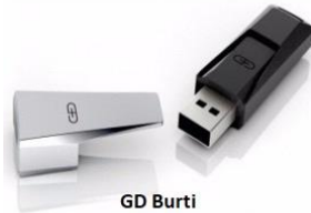
GD Burti 32 Bits