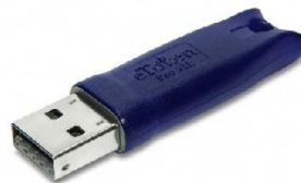
Aladdin 64 Bits