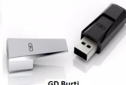
GD Burti 64 Bits