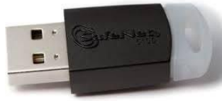
Safenet 5100 32 Bits

Clique na imagem para fazer o download do driver