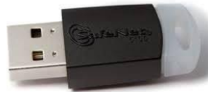
Safenet 5100 64 Bits