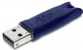
Aladdin 32 Bits